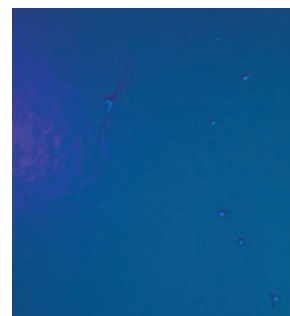
Onder UV-licht inspectie zijn gaatjes (pinholes) gemakkelijk te identificeren.