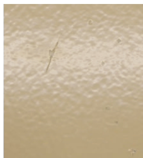
Bij inspectie onder wit licht zijn gaatjes (pinholes) moeilijk te zien.